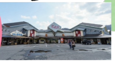
阿賀の里 東蒲原郡阿賀町石間4301 TEL.0254-99-2121 営業：9:00～17:00 休み：無休交通：磐越道安田IC、三川ICから車で約10分 http://aganosato.web.fc2.com/