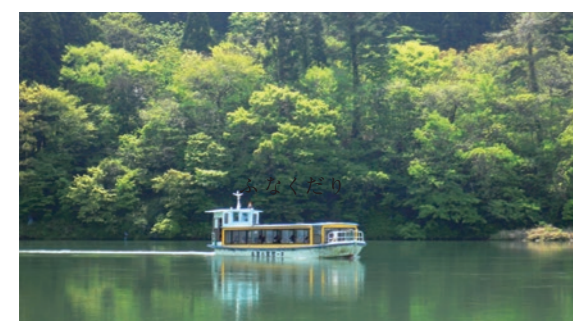
阿賀野川ライン舟下りは約40分の阿賀野川クルーズ。大人2,500円（12月上旬～4月上旬の「雪見舟航路」は2,000円）

お隣阿賀町の道の駅「阿賀の里」では阿賀野川ライン舟下りが楽しめる。施設内には地酒やおみやげ販売、食事処がある「夢蔵」や海産物や浜焼きを販売する「魚匠」などがある。