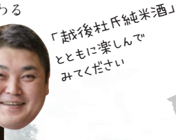
「越後杜氏純米酒」とともに楽しんでみてください